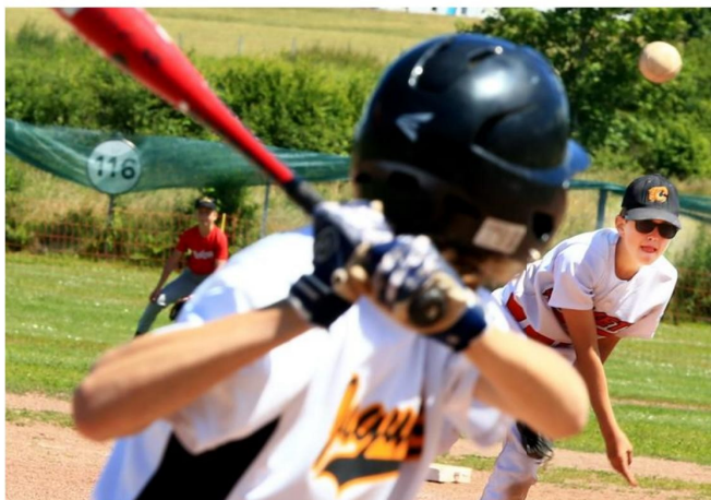
L. H. Direction la finale nationale pour les U15 messins.

« Je suis fier de la réaction de cette jeune équipe. On n'a qu'un seul enfant de 15 ans dans le groupe », souligne David Ten Eyck. Comme en 2017, le coach de Metz/Argancy conduira ses protégés en finale nationale, à l'automne.