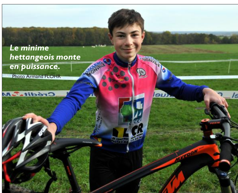
Le minime hettangeois monte en puissance.